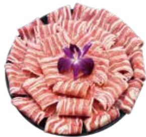
紐澳小羔羊(重組須熟食) NZ and AU Lamb Shoulder: ニュージーランドとオーストラリア産ラム肩 뉴질랜드 및 호주 새끼양 목살~สันนอกแกะ~สัตว์ครึ่งตัวแช่แข็งและออสเตรเลีย Vai cừu non New Zealand và Úc