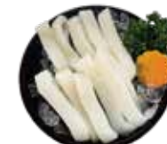
深海透抽 Squid: イカ 오징어~ปลาหมึกก้นแหลมสด Mực ống