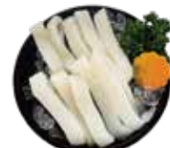
深海透抽 Squid: イカ 오징어~ปลาหมึกก้นแหลมสด Mực ống