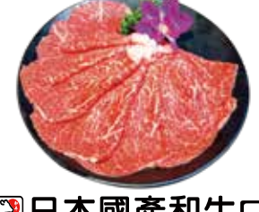
日本國產和牛F1 Japanese F1 Domestic Wagyu: 日本F1國產和牛 일본 F1 국내 와규~เนื้อวัวจากชนิด F1 ของญี่ปุ่น Bò Wagyu lai F1 sản xuất trong nước Nhật Bản

Three Major Wagyu Beef: 世界三大和牛~세계 삼대 와규 เนื้อวัวที่สามสายพันธุ์ที่ยอดเยี่ยมที่สุดในโลก~Ba loại bò Wagyu hàng đầu thế giới