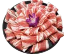
精選豚五花 Pork Belly: 豚ばら肉 삼겹살,หมูสามชั้น Thịt ba chỉ heo