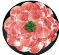
精選豚梅花 Pork Shoulder Butt: 豚肩ロース 돼지 목살,สันคอหมู Thịt nạc vai heo

Pork and Chicken Buffet: 豚肉と鶏肉食べ放題 돼지고기와 닭고기 무제한~한미와ไก่ที่กินได้ไม่อั้น~Buffet heo và gà chọn lọc