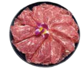
美國SRF極黑和牛 SRF Wagyu: อเมริกา産SRF極黑和牛 미국SRF 흑와규~เนื้อสัตว์จากัว SRF เกเรดพรีเมียมจากอเมริกา Bò Wagyu cực đen SRF Hoa Kỳ