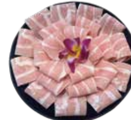
A級松阪豚(丹麥.荷蘭.西班牙) Class A Matsusaka Pig: スペシャルクラスA松阪豚 스페셜 클래스 A 마쓰 사카 돼지~สันคอหมูเกรด A Thịt heo Matsusaka hạng A