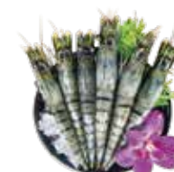
巨大海虎蝦 Giant sea tiger prawns: 大海老 대왕새우~กุ้งลายเสือยักษ์ เกเรดคัดพิเศษ Tôm hùm