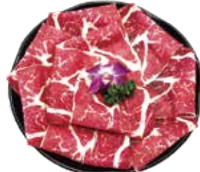
美國CAB安格斯黑牛 US Angus Beef: アンガスビーフ 앵거스 비프,เนื้อสัตว์เกรด CAB จากอเมริกา Bò đen Angus CAB Hoa Kỳ

Angus Beef Buffet: アンガス黒毛肉食べ放題 블랙 앵거스 무제한 리필~牛 فقطเนื้อสัตว์~Bò đen Angus ăn thoải mái