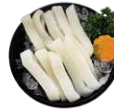
深海透抽 Squid: イカ 오징어~ปลาหมึกก้นแหลมสด Mực ống