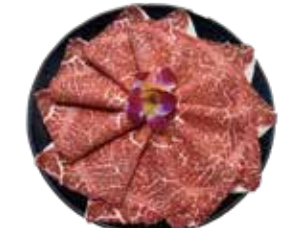
澳洲冠軍黑毛和牛 AU Wagyu Beef: オーストラリア産和牛 호주산 풀 블러드 흑우 와규~แชมป์เนื้อสัตว์จากัวพันธุ์แทกรด ออสเตรเลีย Bò wagyu Úc