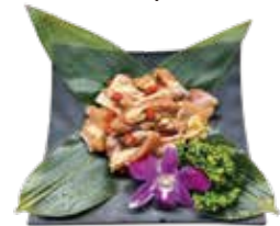
陳釀花雕雞腿 Stir-fried Chicken with Chinese Sauce: 鶏肉の紹興酒蒸き込み 소용 닭고기 조림,ไก่กวน,ไก่ยัด Gà Hoa Đào kiểu Hồng Kông