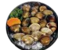
新鮮蛤蜊 Clam: ハマグリ 조개~หอยตลับจากคลองชอง Nghêu