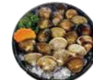
新鮮蛤蜊 Clam: ハマグリ 조개~หอยตลับจากคลองชอง Nghêu