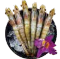
藍鑽蝦 Blue Diamond Shrimp: 블루다이아몬드エビ 블루 다이아몬드 새우~กุ้งไข่มุกขนาด tôm trắng