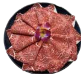
澳洲冠軍黑毛和牛 AU Wagyu Beef: オーストラリア産和牛 호주산 풀 블러드 흑우 와규~แชมป์เนื้อสัตว์จากัวพันธุ์แทกรด ออสเตรเลีย Bò wagyu Úc

Matsusaka Pig Premium Wagyu Buffet: 松阪牛食べ放題 마쓰사카우 무제한~เนื้อวัวพรีเมียม~Thịt bò Matsusaka ăn thoải thích