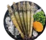
鮮甜白蝦 White Shrimp: 白エビ 자연산 대하~กุ้งขาวแปะพีค Tôm biển hoàng dã