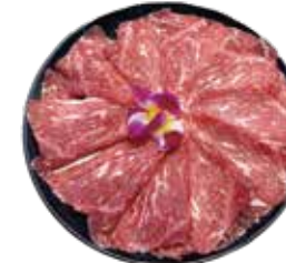
美國SRF極黑和牛 SRF Wagyu: アメリカ産SRF極黑和牛 미국SRF 흑와규~เนื้อสัตว์จากัว SRF เกเรดพรีเมียมจากอเมริกา Bò Wagyu cực đen SRF Hoa Kỳ

Premium Sannomiya Beef: 極上二和牛 최상급 산노미야 소고기~เนื้อวัวญี่ปุ่นชั้นยอด~Bò Sannomiya cao cấp ăn thoải mái