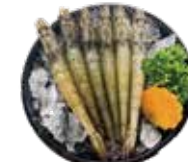
鮮甜白蝦 White Shrimp: 白エビ 자연산 대하~กุ้งขาวแปะพีค Tôm biển hoàng dã