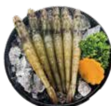
鮮甜白蝦 White Shrimp: 白エビ 자연산 대하~กุ้งขาวแปะพีค Tôm biển hoàng dã