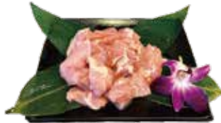
精選無骨嫩雞腿 Boneless Chicken Leg: 骨なし鶏もも肉 순살 닭다리,เนื้อไก่ไม่มีกระดูก Dùi gà