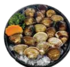
新鮮蛤蜊 Clam: ハマグリ 조개~หอยตลับจากคลองชอง Nghêu