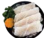
鮮嫩巴沙魚 Basa Fish: パシヤ魚 베트남메기,ปลาสดสด Cá ba sa