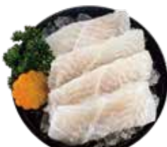
鮮嫩巴沙魚 Basa Fish-バンシャ魚 베트남메기·ปลาสดสด Cá ba sa