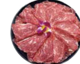
美國SRF極黑和牛 SRF Wagyu-アメリカ産SRF極黒和牛 미국SRF 흑와규·เนื้อวัวดำตัว SRF เกียรติพรีเมียมจากอเมริกา Bò Wagyu cực đen SRF Hoa Kỳ