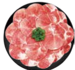
精選豚梅花 Pork Shoulder Butt 豚肩ロース 돼지 목살·สันนอกหมู Thịt nạc vai heo

Pork and Chicken Buffet: 豚肉及雞肉食べ放題 돼지고기와 닭고기 무제한·หมูและไก่ฟัดกินไม่อั้น·Buffet heo và gà chọn lọc