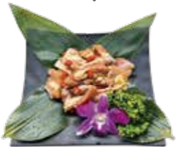
陳釀花雕雞腿 Stir-fried Chicken with Chinese Sauce·雞肉の紹興酒蒸込み 소용 닭고기 조림·肉の紹興酒蒸込み Gà Hươu Diêu Kiều Hồng Kông