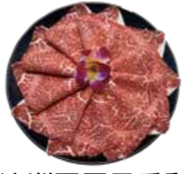
澳洲冠軍黑毛和牛 AU Wagyu Beef-オーストラリア産和牛 호주산 풀 블러드 흑우 와규·แชมป์เนื้อวัวดำจากฟาร์มในไทย ออสเตรเลีย Bò wagyu Úc

Matsusaka Pig Premium Wagyu Buffet: 松阪牛食べ放題 마쓰사카우 무제한·เนื้อวัวพรีเมียมจากฟาร์มในไทย·Thịt bò Matsusaka ăn thoải thích