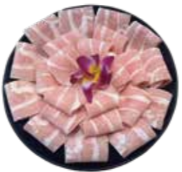
A級松阪豚(丹麥·荷蘭·西班牙) Class A Matsusaka Pig-スペシャルクラスA松阪豚 스페셜 클래스 A 마쓰 사카 돼지·산นอกหมูเกรด A Thịt heo Matsusaka hạng A