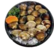
新鮮蛤蠣 Clam-ハマグリ 조개·หมอบคั้งจากตงซ้อ Nghêu