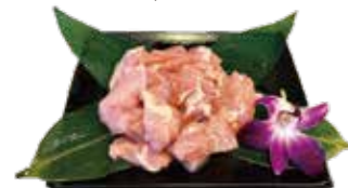
精選無骨嫩雞腿 Boneless Chicken Leg 骨なし鶏もも肉 순살 닭다리·雞腿肉 Đùi gà