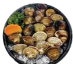
新鮮蛤蠣 Clam-ハマグリ 조개·หมอบคั้งจากตงซ้อ Nghêu