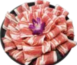
精選豚五花 Pork Belly 豚ばら肉 삼겹살·หมูสามชั้น Thịt ba chỉ heo