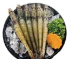
鮮甜白蝦 White Shrimp-白エビ 자연산 대하·กุ้งขาวแปะพีค Tôm biển hoàng dã