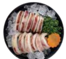
深海魷魚 Squid-イカ 오징어·ปลาหมึกก้นแหลมสด Mực ống