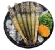
鮮甜白蝦 White Shrimp-白エビ 자연산 대하·กุ้งขาวแปะพีค Tôm biển hoàng dã