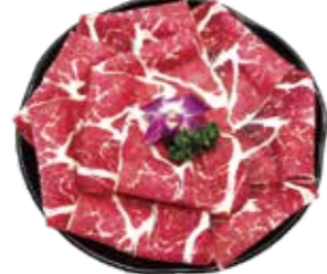
美國CAB安格斯黑牛 US Angus Beef: アンガスビーフ 앵거스 비프. แอสคองกัส CAB จากอเมริกา Bò đen Angus CAB Hoa Kỳ

Angus Beef Buffet: アンガス黒肉食べ放題 블랙 앵거스 부한 리필 뷔페. หมูและไก่ทานไม่อั้น. Buffet heo và gà chọn lọc