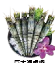
巨大海虎蝦 Giant sea tiger prawns: 大海老 대형새우. กุ้งลายเสือทะเลเกรดพรีเมียม Tôm hùm