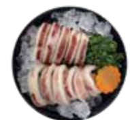
深海魷魚 Squid: イカ 오징어. ปลาหมึกก้นแหลมสด Mực ống