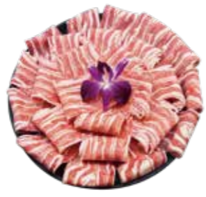
紐澳小羔羊(重組須熟食) NZ and AU Lamb Shoulder: ニューージーランドとオーストラリア産ラム肩 뉴질랜드 및 호주 새끼양 목살. สันนอกและคัสตง. โครงหนังชั้นและคอสดและออสเตรเลีย Vai cừu non New Zealand và Úc