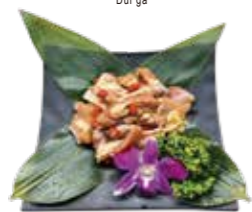
陳釀花雕雞腿 Stir-fried Chicken with Chinese Sauce: 鶏肉の紹興酒蒸込み 소용 닭고기 조림 花雕酒蒸雞 Gà Hua Diao kiêu Hồng Kông