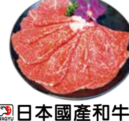
日本國產和牛F1 Japanese F1 Domestic Wagyu: 日本F1国産和牛 일본 F1 국내 와규. เนื้อวัวที่ขงต้น F1 ของญี่ปุ่น Bò Wagyu lai F1 sản xuất trong nước Nhật Bản

Three Major Wagyu Beef: 世界三大和牛. 세계 삼대 와규 เนื้อวัวที่สามสายพันธุ์ที่ยอดเยี่ยมที่สุดในโลก. Ba loại bò Wagyu hàng đầu thế giới