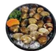
新鮮蛤蠣 Clam: ハマグリ 조개. หมอฉลิมจากคองซ็อง Nghêu