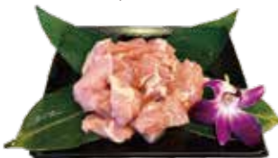
精選無骨嫩雞腿 Boneless Chicken Leg: 骨なし鶏もも肉 순살 닭다리 无骨鸡腿肉 Dùi gà