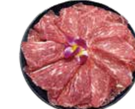
美國SRF極黑和牛 SRF Wagyu: アメリカ産SRF極黒和牛 미국SRF 흑와규. เนื้อบดควากัว SRF เกรดพรีเมียมจากอเมริกา Bò Wagyu cực đen SRF Hoa Kỳ