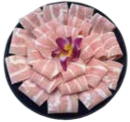
A級松阪豚(丹麥.荷蘭.西班牙) Class A Matsusaka Pig: スペシャルクラスA松阪豚 스페셜 클래스 A 미쓰 사카 돼지. สันคอหมูเกรด A Thịt heo Matsusaka hạng A