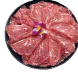
美國SRF極黑和牛 SRF Wagyu: アメリカ産SRF極黒和牛 미국SRF 흑와규. เนื้อบดควากัว SRF เกรดพรีเมียมจากอเมริกา Bò Wagyu cực đen SRF Hoa Kỳ

Premium Sannomiya Beef: 極上二和牛 최상급 산노미야 소고기. เนื้อวัวญี่ปุ่นชั้นยอด. Bò Sannomiya cao cấp ăn thoải mái