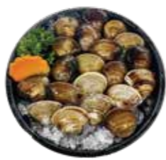
新鮮蛤蠣 Clam: ハマグリ 조개. หมอฉลิมจากคองซ็อง Nghêu