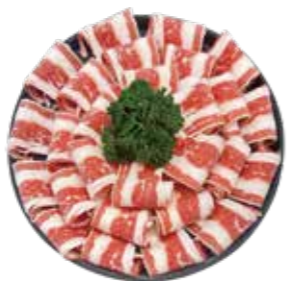
美國頂級牛胸腹肉 US Beef Brisket Steak: チヨイスビーフブリスケット 미국산 초이스 등급 우삼겹. เนื้อวัวสามชั้น จากอเมริกา Bít-tết ức bụng bò Hoa Kỳ