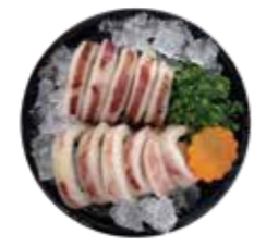
深海魷魚 Squid: イカ 오징어. ปลาหมึกก้นแหลมสด Mực ống