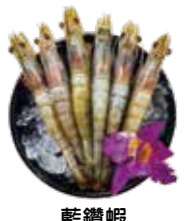
藍鑽蝦 Blue Diamond Shrimp: ブルーダイヤモンドエビ 블루 다이아몬드 새우. กุ้งไข่มุกไข่มุก tôm trắng