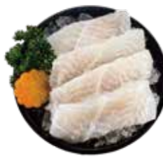
鮮嫩巴沙魚 Basa Fish: バシヤ魚 베트남메기. ปลาสาบลิ้นสด Cá ba sa