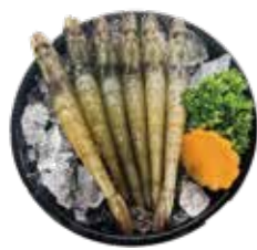
鮮甜白蝦 White Shrimp: 白エビ 자연산 대하.กุ้งขาวแปงพัก Tôm biển hoàng dã