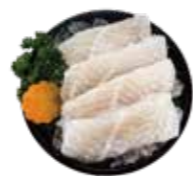
鮮嫩巴沙魚 Basa Fish: バシヤ魚 베트남메기. ปลาสาบลิ้นสด Cá ba sa