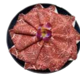
澳洲冠軍黑毛和牛 AU Wagyu Beef: オーストラリア産和牛 호주산 풀 블러드 흑우 와규. แชมป์เนื้อบดควากัวพันธุ์แทกรด ออสเตรเลีย Bò wagyu Úc