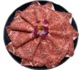
澳洲冠軍黑毛和牛 AU Wagyu Beef: オーストラリア産和牛 호주산 풀 블러드 흑우 와규 buffet 澳洲冠軍黑毛和牛 澳洲冠軍黑毛和牛 Bò wagyu Úc

Matsusaka Pig Premium Wagyu Buffet: 松阪牛食べ放題 마쓰사카우 무제한 리필 buffet 松阪豚和牛 松阪豚和牛 松阪豚和牛