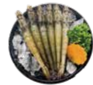
鮮甜白蝦 White Shrimp: 白エビ 자연산 대하 鮮甜白蝦 Tôm biển hoàng dã