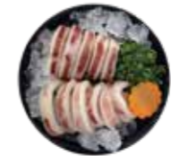
深海魷魚 Squid: イカ 오징어 深海魷魚 深海魷魚 mực ống