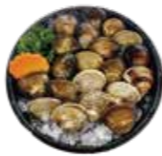
新鮮蛤蜊 Clam: ハマグリ 조개 新鮮蛤蜊 新鮮蛤蜊 Nghêu