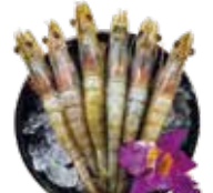
藍鑽蝦 Blue Diamond Shrimp: 블루다이아몬드 블루 다이아몬드 새우 藍鑽蝦 藍鑽蝦 tôm trắng