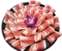
精選豚五花 Pork Belly: 豚ばら肉 삼겹살 豚五花 Thịt ba chỉ heo