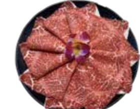
澳洲冠軍黑毛和牛 AU Wagyu Beef: オーストラリア産和牛 호주산 풀 블러드 흑우 와규 buffet 澳洲冠軍黑毛和牛 澳洲冠軍黑毛和牛 Bò wagyu Úc