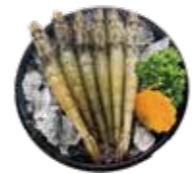
鮮甜白蝦 White Shrimp: 白エビ 자연산 대하 鮮甜白蝦 Tôm biển hoàng dã