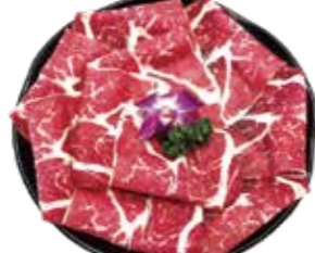
美國CAB安格斯黑牛 US Angus Beef: アンガスビーフ 앵거스 비프 CAB 安格斯黑牛 Bò đen Angus CAB Hoa Kỳ

Angus Beef Buffet: アンガス黒肉肉食べ放題 블랙 앵거스 부한 리필 buffet 安格斯黑牛 安格斯黑牛 安格斯黑牛 安格斯黑牛