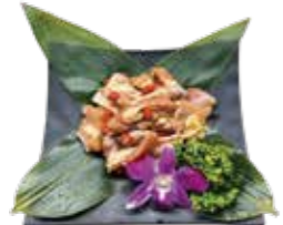
陳釀花雕雞腿 Stir-fried Chicken with Chinese Sauce: 鶏肉の紹興酒蒸込み 소용 닭고기 조림 花雕酒蒸雞 Gà Hua Diao kiêu Hồng Kông