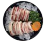
深海魷魚 Squid: イカ 오징어 深海魷魚 深海魷魚 mực ống