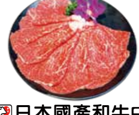
日本國產和牛F1 Japanese F1 Domestic Wagyu: 日本F1國產和牛 일본 F1 국내 와규 buffet 日本國產和牛 日本國產和牛 Bò Wagyu lai F1 sản xuất trong nước Nhật Bản

Three Major Wagyu Beef: 世界三大和牛 네오아기삼대 와규 buffet 世界三大和牛 世界三大和牛 世界三大和牛