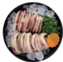
深海魷魚 Squid: イカ 오징어 深海魷魚 深海魷魚 mực ống