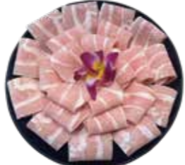
A級松阪豚(丹麥.荷蘭.西班牙) Class A Matsusaka Pig: スペシャルクラスA松阪豚 스페셜 클래스 A 마쓰 사카 돼지 buffet 松阪豚 松阪豚 松阪豚 Thịt heo Matsusaka hạng A