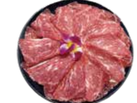
美國SRF極黑和牛 SRF Wagyu: アメリカ産SRF極黑和牛 미국SRF 흑와규 buffet 美國SRF極黑和牛 美國SRF極黑和牛 Bò Wagyu cực đen SRF Hoa Kỳ