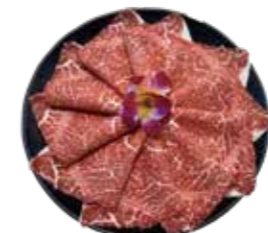
澳洲冠軍黑毛和牛 AU Wagyu Beef: オーストラリア産和牛 호주산 풀 블러드 흑우 와규 buffet 澳洲冠軍黑毛和牛 澳洲冠軍黑毛和牛 Bò wagyu Úc