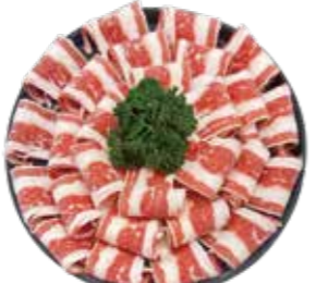
美國頂級牛胸腹肉 US Beef Brisket Steak: チョイスビーフブリスケット 미국산 초이스 등갈 우삼겹 buffet 美國頂級牛胸腹肉 Bít-tết ức bụng bò Hoa Kỳ