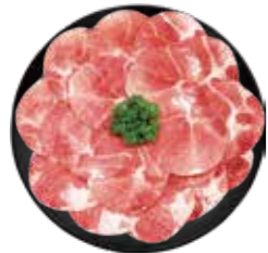
精選豚梅花 Pork Shoulder Butt: 豚肩ロース 돼지 목살 삼겹살 Thịt nạc vai heo

Pork and Chicken Buffet: 豚肉と鶏肉食べ放題 돼지고기와 닭고기 무제한 buffet 和鶏肉と鶏肉の Buffet heo và gà chọn lọc