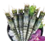
巨大海虎蝦 Giant sea tiger prawns: 大海老 대왕새우 巨大海虎蝦 巨大海虎蝦 Tôm hùm