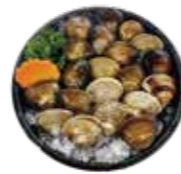
新鮮蛤蜊 Clam: ハマグリ 조개 新鮮蛤蜊 新鮮蛤蜊 Nghêu