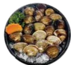
新鮮蛤蜊 Clam:ハマグリ 조개 新鮮蛤蜊 新鮮蛤蜊 Nghêu