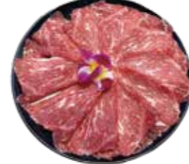
美國SRF極黑和牛 SRF Wagyu: アメリカ産SRF極黑和牛 미국SRF 흑와규 buffet 美國SRF極黑和牛 美國SRF極黑和牛 Bò Wagyu cực đen SRF Hoa Kỳ

Premium, Sannomiya Beef: 極上二和牛 최상급 산노미야 소고기 buffet 極上雙和牛 極上雙和牛 極上雙和牛